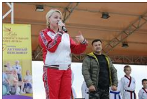
Праздник спорта в честь Дня пожилого человека Команда Активных пенсионеров в составе не менее 60 человек приняла участие в ПРАЗДНИКЕ СПОРТА, посвященному Дню пожилого человека