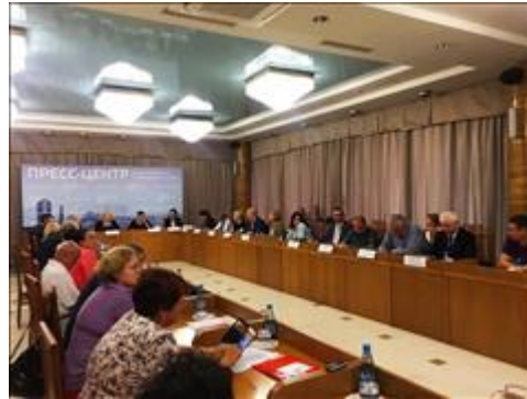
Круглый стол Представители БФ «Ника» и Школы «Активный пенсионер» приняли участие в круглом столе. Общественная палата ПК совместно с АНО "Развитие" провели круглый стол по теме: "Реализация комплексного плана по обеспечению доступа СО НКО к предоставлению услуг в социальной сфере".