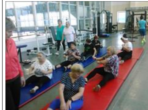
Зарядка на свежем воздухе Проходила в ноябре в зале ДЮСШ ПРИМОРЕЦ

Мероприятие: Освещение мероприятий в СМИ, соц. сетях и сайте фонда всего не менее 5 публикаций.