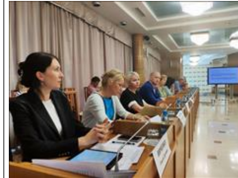
Круглый стол В ходе заседания обсудили как проблематику доступа к оказанию социальных услуг, так и лучшие практики успешной работы СО НКО в качестве поставщиков социальных услуг

Мероприятие: В рамках работы благотворительного магазина получили вещевую помощь малоимущие пенсионеры и ветераны