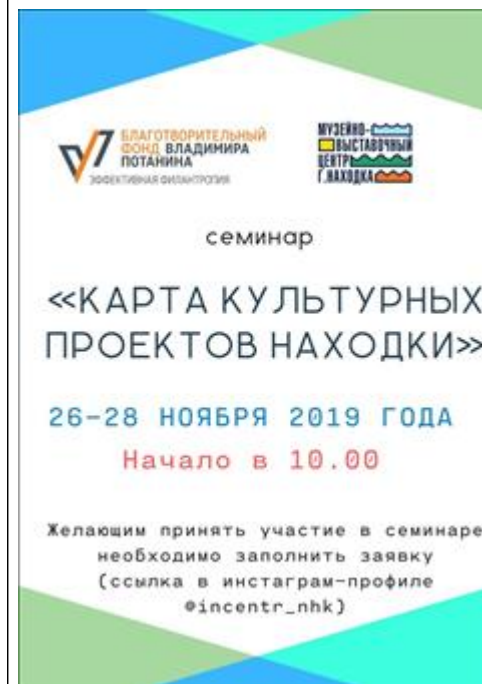
афиша семинара Приняли участие в семинаре