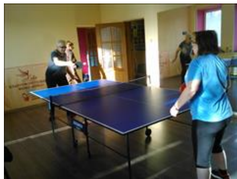
7 Курс настольного тенниса и ОФП Получили услуги 9 человек