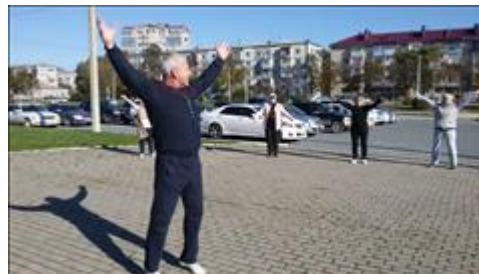
Зарядка на свежем воздухе На площадке ДЮСШ ПРИМОРЕЦ