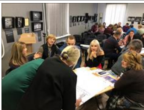
Семинар 26 -28.11.19 Приняли участие в семинаре

Мероприятие: Представители БФ «Ника» и Школы «Активный пенсионер» приняли участие в круглом столе