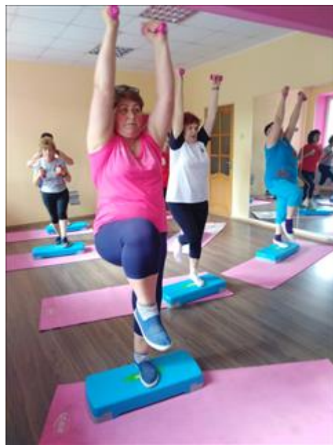
7 Курс танцевальной гимнастике Получили услуги 21 человек