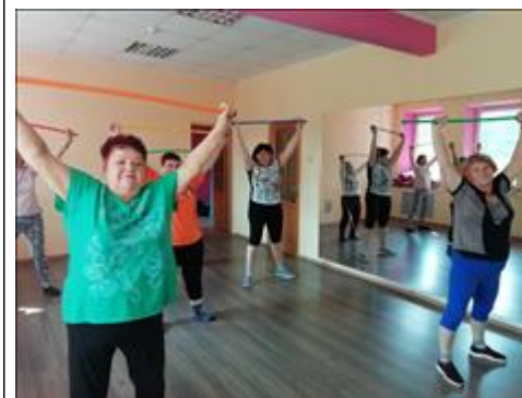
7 Курс ЛФК

Мероприятие: Проведен 7 курс обучения в Школе "Активный пенсионер"