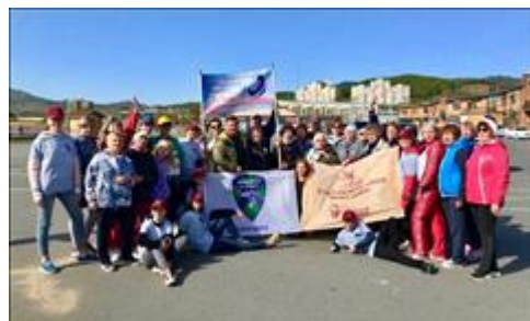
Праздник спорта в честь Дня пожилого человека 5 октября

Мероприятие: Проведен 7 курс обучения в Школе "Активный пенсионер"