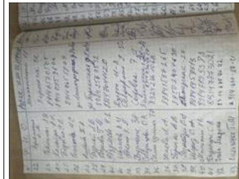
Вещевая помощь малоимущим участникам проекта В рамках реализации проекта "Магазина Добра" получили помощь