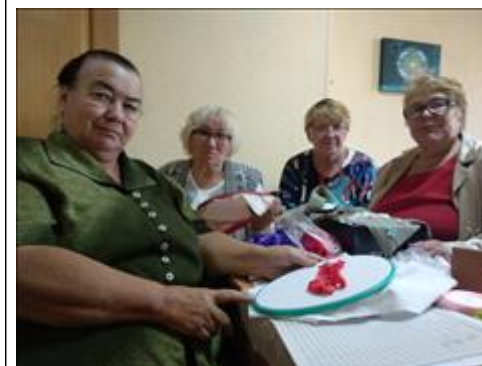
7 Курс творческой мастерской Получили услуги 6 человек