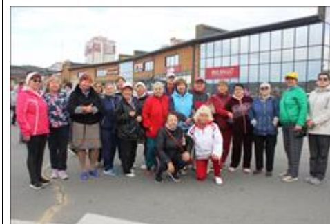
Праздник спорта в честь Дня пожилого человека 5 октября