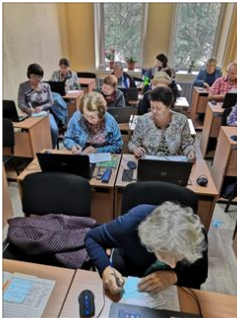
7 Курс компьютерной грамотности Услуги получили 18 человек